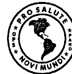
TABLA DE COMPOSICIÓN DE ALIMENTOS DE CENTROAMÉRICA SEGUNDA SECCIÓN

Oficina Panamericana de la Salud (OPS) Instituto de Nutrición de Centro América y Panamá (INCAP)